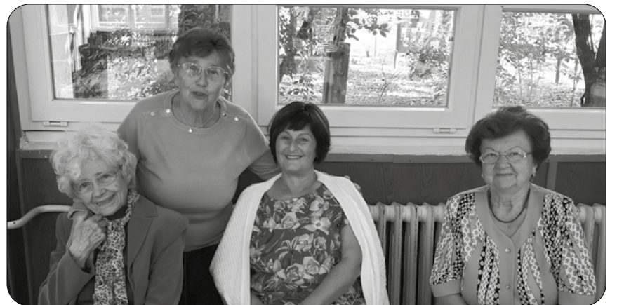
A résztvevők egy csoportja