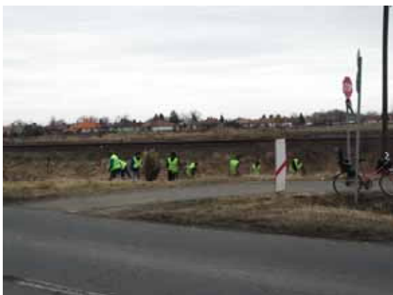
Kerékpárút melletti terület takarítása