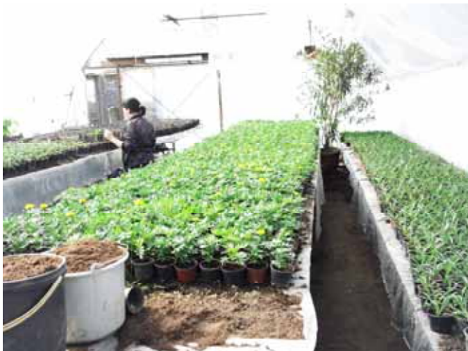
Virágpalánta nevelés 2.