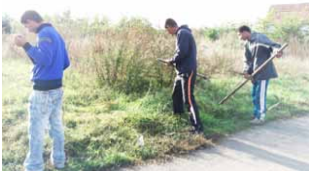
Kaszálás kézi kaszával a közút projekt keretében