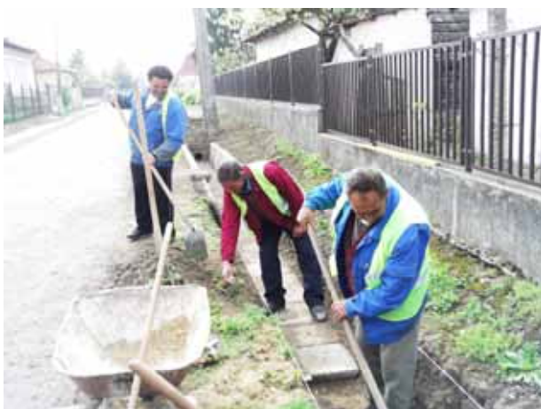
Árokburkolás a belvíz projekt keretében