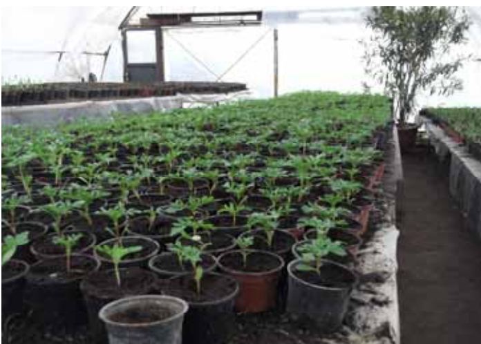
Virágpalánta nevelés 1.