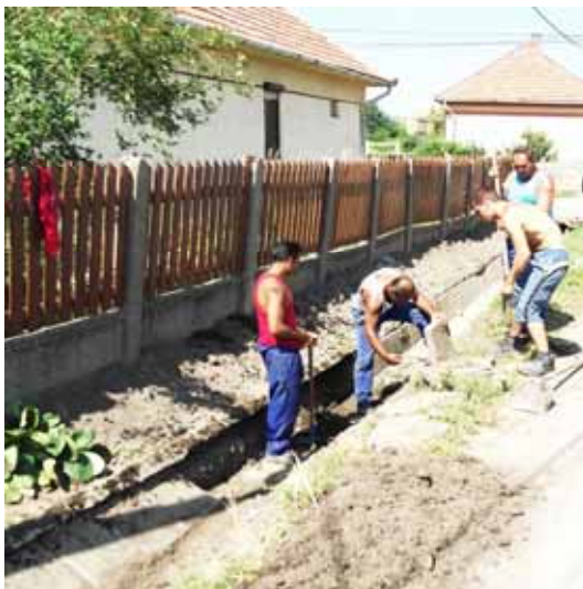
Árokkelújítás a Kisfaludy úton