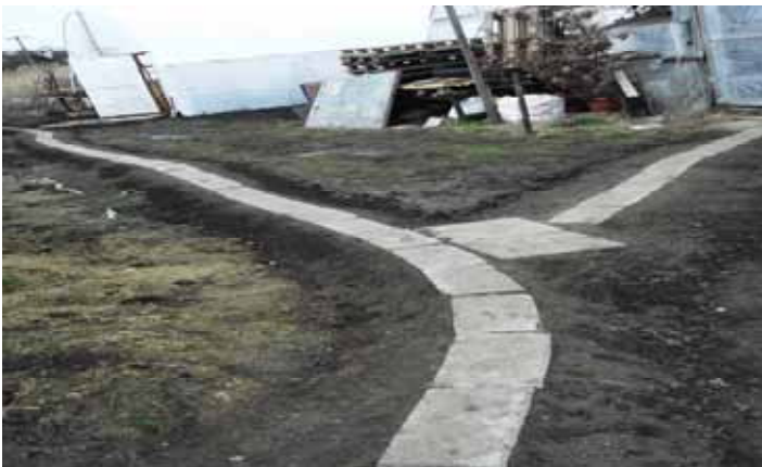
Járda kialakítása a fóliasátrak között

Ez a projektelem csupán két hónapos támogatottsági időszakot tett lehetővé, és 9 fő foglalkoztatását biztosította, de rendkívül nagy jelentősége volt a mezőgazdasági projekt előkészítési munkálataiban, valamint a tavaszi-nyári virágpalánták nevelésében.