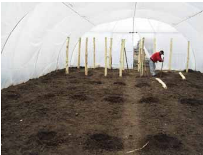
Támrendszer kialakítása a fóliában