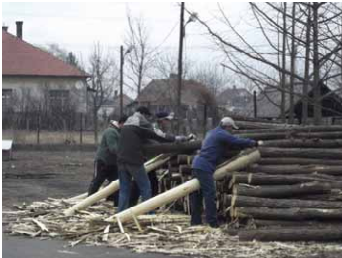
Faoszlopok háncsának leszedése