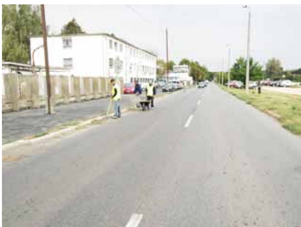
Útpadka takarítás, rendbetétel