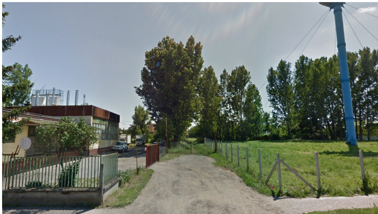
Telek a Gépállomás utca felől