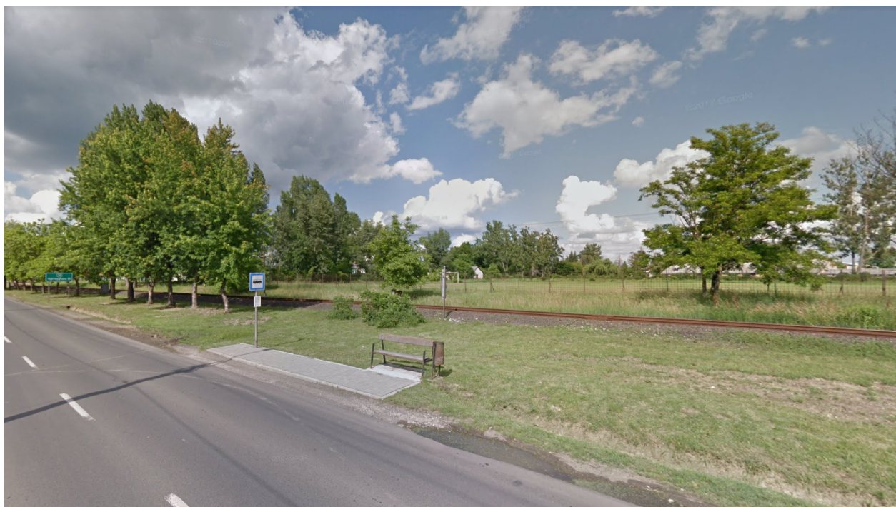
Telek a Petőfi utca felől